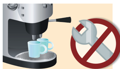
Installazione semplice e veloce

È disponibile inoltre una cloning card che permette di trasferire le consumazioni e la programmazione da una macchina all'altra.