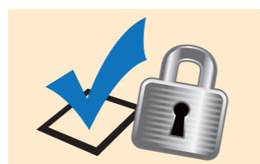
Sicurezza delle transazioni