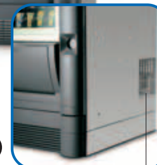
Uscita laterale aria calda