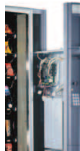
Vano separato con accesso indipendente ai sistemi di pagamento e alla scheda elettronica

Snakky by Necta è provvisto di un vano prelievo prodotto ergonomico (brevettato) con dispositivo antifurto e movimento di chiusura rallentato. Il vano è caratterizzato da una grande robustezza, un'ottima visibilità del prodotto erogato e un'altezza prelievo prodotto ottimale. Il nuovo gruppo refrigerante monoblocco slide-in/slide-out vanta una manutenzione ridotta grazie al nuovo condensatore a fili (uso domestico) nonché un facile accesso e una veloce sostituzione. I sistemi di pagamento e la scheda elettronica sono collocati nel vano separato completamente estraibile e con accesso indipendente, per facilitare qualsiasi tipo di intervento in quest'area, senza influenzare la temperatura all'interno della cella prodotti. Snakky by Necta offre inoltre la possibilità di erogare bottiglie PET da 0,5 l capovolte senza l'utilizzo di nessun tipo di accessorio.